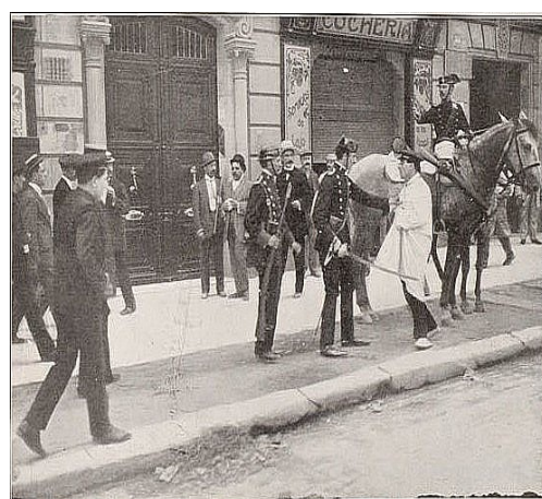
La guardia civil deteniendo a un revoltoso en la calle Pelayo de Barcelona.

La censura se va adueñando de los canales de comunicación y cesa el flujo de noticias sediciosas sobre Alcoy. La narración secuencial de los hechos se dificulta. Ya solo hay una fuente, la versión oficial, y cualquier opinión que cuestione este punto de vista será denunciada y