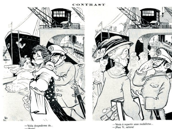
La Campana de Gràcia, 24 juliol 1909. Uno de los periódicos satírico-políticos tan frecuentes en aquellos tiempos.

También es el caso de la proliferación institucionalizada de caritativos grupos de mujeres ( Juntas de Damas ) generalmente de clase media-alta, que recaudando fondos para los militares y heridos, organizando soporíferos actos benéficos o acudiendo compungidas a repartir calderilla, tabaco y estampitas a los soldados que marchaban para Melilla, no buscaban otra cosa que deslegitimar el papel consustancial de las mujeres y obreras tanto en las revueltas como en las tareas asistenciales que emprendían 16 .