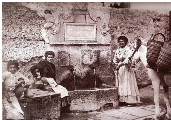
Alcoyanas en la Fuente del Puente de Cocentaina.

A continuación, y mientras muchos aún definían posiciones en plazas y cafés, se organizó por un lado, una manifestación de miembros de las sociedades obreras encabezada por la La Unión del Arte Fabril en la que se lanzaron consignas anticlericales y antimilitaristas y se llamó a la huelga general. Por otro, obreras, madres y niños que recorrieron la población, clamando contra la guerra y demandando de puerta en puerta la solidaridad con las familias de los reservistas 4 .