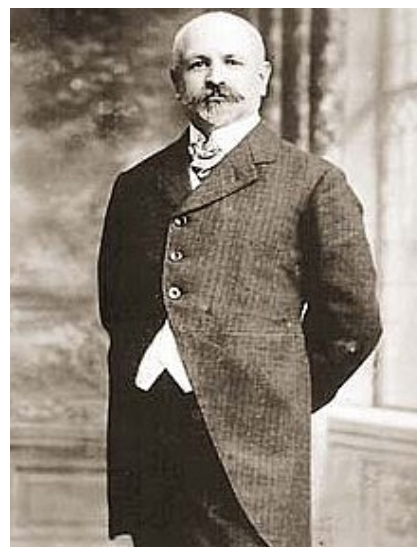
Ferrer fue asesinado tras un juicio farsa que queda como ejemplo histórico de impunidad y terrorismo de estado.

La noche del día 14 de octubre, una vez confirmado oficialmente el rumor del más que anunciado asesinato de estado de Francisco Ferrer Guardia, comienzan las reacciones y algunos anarquistas alicantinos pegan carteles denunciando el hecho, lo que al parecer generó algunas detenciones. No trascendió noticia oficial 28 .