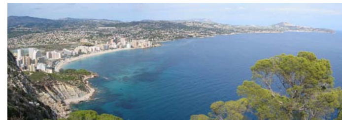
Vista desde el Peñón de Ifach

¡No te olvides llevarte saco de dormir (dormiremos en las camas de un albergue) y bañador! (por si acaso)