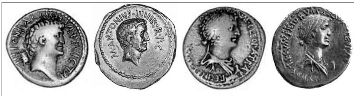
Figura 1. Representacions originals de Marc Antoni (1-2) i Cleòpatra (3-4) en monedes.

Segons diuen, la seua bellesa no era tal que enlluernara o que deixara parats els qui la veien; però el seu tracte tenia un atractiu inevitable, i la seua figura, ajudada de la seua parla i d'una gràcia inherent a la seua conversa, semblava que deixava clavats un agulló en l'ànim. Quan parlava, el so mateix de la seua veu tenia una certa dolçor, i amb la major facilitat acomodava la seua llengua, com un orgue de moltes cordes, a l'idioma que es volguera (Plutarc, Vides paral·leles , Antoni XXVII).