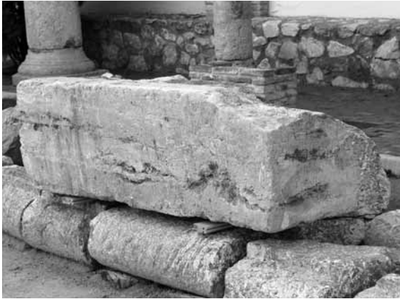
Lámina 2. Lateral izquierdo y superficie escrita del pedestal ecuestre.

Esta circunstancia, las dimensiones del bloque y el hecho de que la inscripción ocupe una de las caras pequeñas de los extremos, permite deducir que se trata de la parte media de un pedestal de estatua ecuestre como los que conocemos en otras ciudades del Imperio Romano.