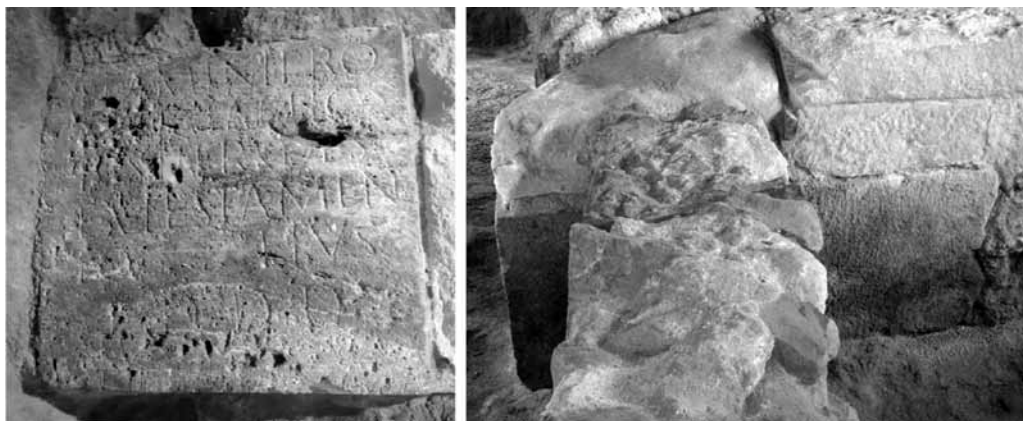
Lámina 8. Vista frontal y lateral del pedestal ecuestre de la calle Honda, de Cartagena, en su estado actual.

Las circunstancias actuales del lugar de conservación hacen que sea visible el lateral del bloque y que pueda comprobarse que no se trata de la parte media de un