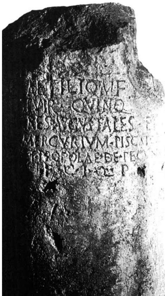
Lámina 4. Columna dedicada por los piscatores et propolae de Carthago Nova durante el duunvirado quinquenal de C. Laetilius M. f. (según Abascal – Ramallo 1997, lámina 42).

La carrera contenida en el pedestal comprende todos los grados de un cursus decurional ordinario y es la misma que ya conocíamos para otro magistrado de