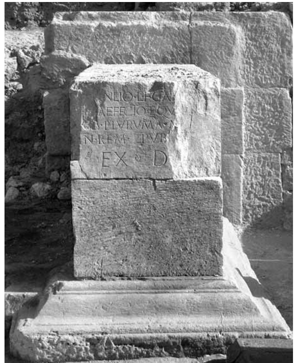
Lámina 7. Pedestal ecuestre compuesto de [- Ma]nlius L. f. Gal. [-], praefectus equitum , en Segobriga, que puede ilustrar el aspecto original del nuevo ejemplar de Cartagena.

En el caso de Segobriga, algunos pedestales ecuestres compuestos cumplen la función de antae de escaleras (lám. 7) 26 , como las que conocemos en pinturas y relieves de Pompeya 27 , de modo que no es descartable que esto pudiera ocurrir también en el caso de Carthago Nova, aunque el desgaste posterior del bloque impide observar las huellas de anathyrosis posterior que podrían avalar esta hipótesis. Con esa simbiosis con los elementos construidos, en algunos foros los pedestales de estatua con inscripciones llegaron a formar un todo con su arquitectura, como expresión de la riqueza de la ciudad y como escaparate de la estructura de sus élites 28 .