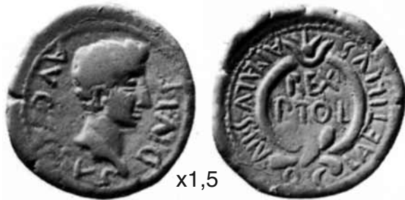
Lámina 5. Emisión de Carthago Nova a nombre de C. Laetilius Apalus y del monarca Ptolomeo (según Ripollès, RPC 172). A 1,5:1 de su tamaño real.

fiere el orden de presentación de los puestos, pues en el nuevo monumento el sacerdocio de los cultos oficiales de la colonia precede a los puestos políticos, que están expresados siguiendo un orden jerárquico ascendente.