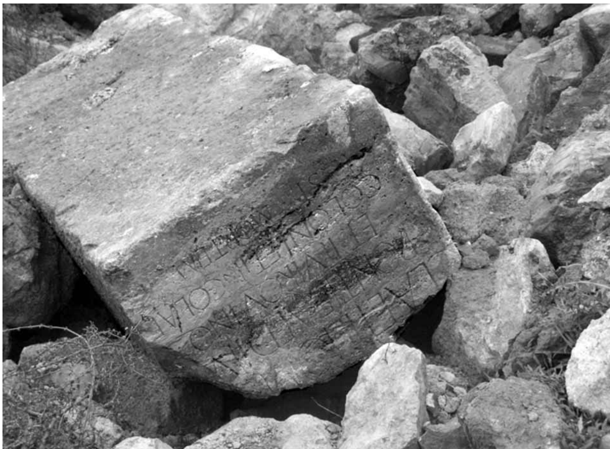
Lámina 1. El nuevo pedestal ecuestre de Carthago Nova en el momento de su descubrimiento.

Cartagena como sustituto del mármol y que ya conocíamos como soporte epigráfico en la ciudad. Sus dimensiones son 54 x 57 cm en la cara escrita, con una profundidad de 172 cm. Aunque sufrió antiguamente algunas roturas, especialmente en los ángulos superiores del lado escrito y en todas las aristas, estas dimensiones corresponden a las originales del monumento. Como consecuencia del reemplazo en épocas posteriores, presenta algo de argamasa adherida que afecta a algunas letras, fundamentalmente a la filiación de la primera línea pero que no impide la lectura del texto. En uno de los laterales inferiores se observan dos huellas en forma de "cola de milano" correspondientes a la grapa que unía esta pieza a otra situada inmediatamente debajo. En uno de los bordes superiores quedan leves evidencias de un tratamiento de anathyrosis lateral.