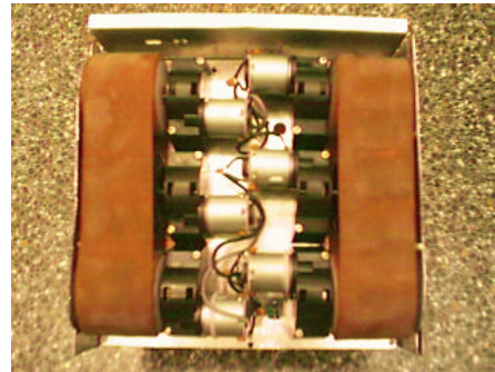
Fig. 1. Vista inferior del microbot

Las limitaciones del concurso nos han hecho decidirnos por un diseño propio basado en una plataforma cuadrangular de 19cm de lado a unos 5cm del suelo.