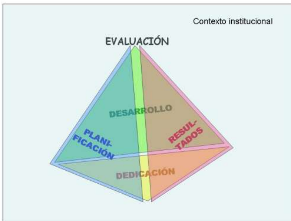
Figura 2. Dimensiones de evaluación de la evaluación docente

El Modelo de evaluación definido en el que se fundamenta el procedimiento para la evaluación de la actividad docente de la Universidad de Alicante, contempla las tres dimensiones establecidas por ANECA en el programa Docencia en el análisis y valoración de la actividad docente: Planificación de la Docencia, Desarrollo de la docencia, y, Resultados. Cada una de estas dimensiones se articula a su vez en un conjunto de elementos, todos ellos representados en la Figura 2.